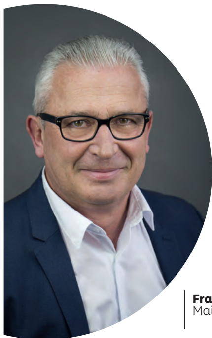
Franck Vallein Maire de Pluneret