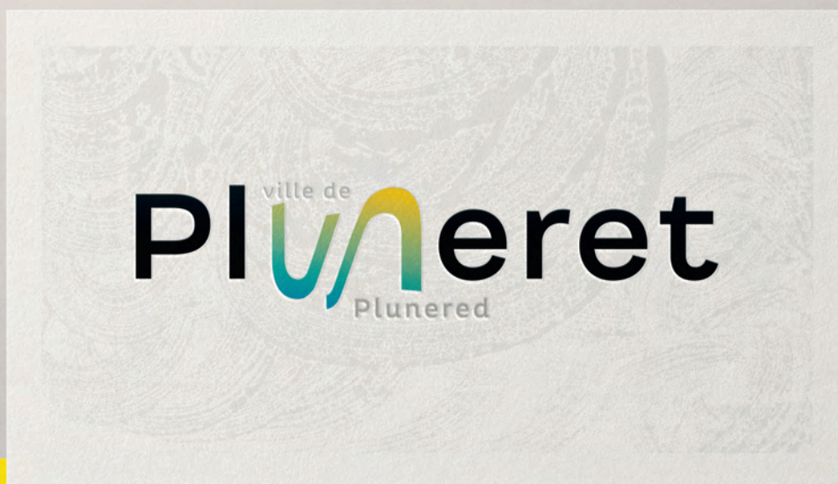
↑ Logo officiel de la ville

↓ Déclinaisons du logo pour s'adapter aux différents supports